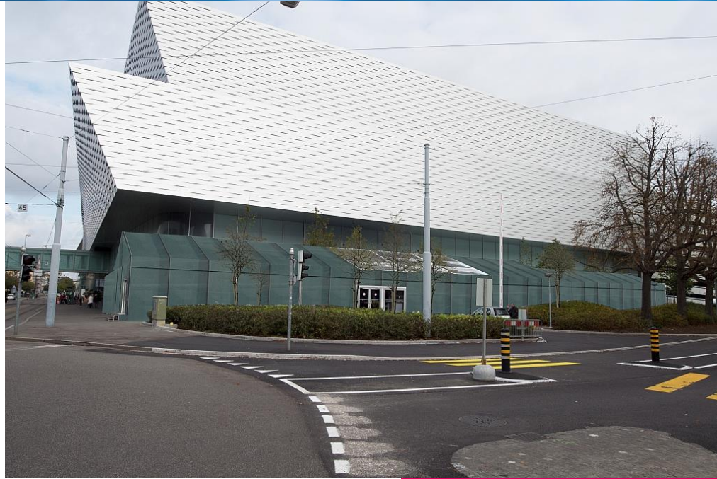
Backstage Village VIP Verpflegung