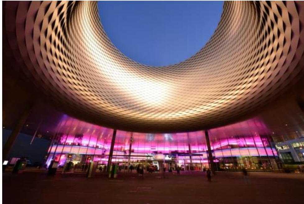
EVENT HALLE BASEL von Herzog & de Meuron konzipiert