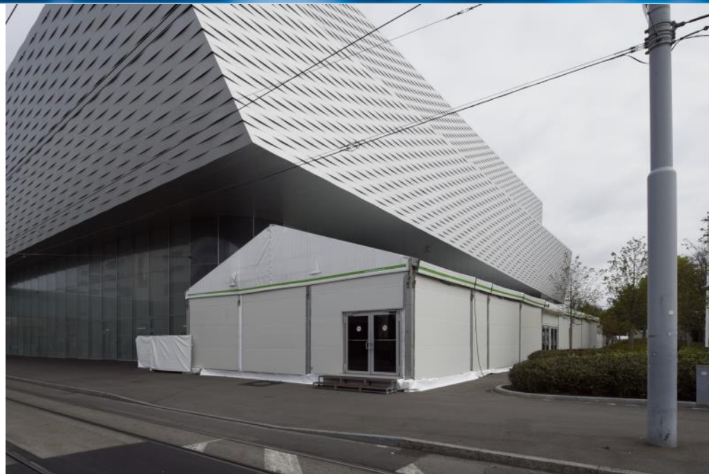
Backstage Village VIP Verpflegung